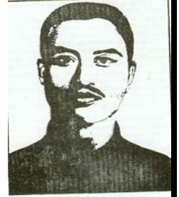
Đồng chí Nguyễn Thái Học Cố Đảng Trưởng VNQDDĐ 1904-1930